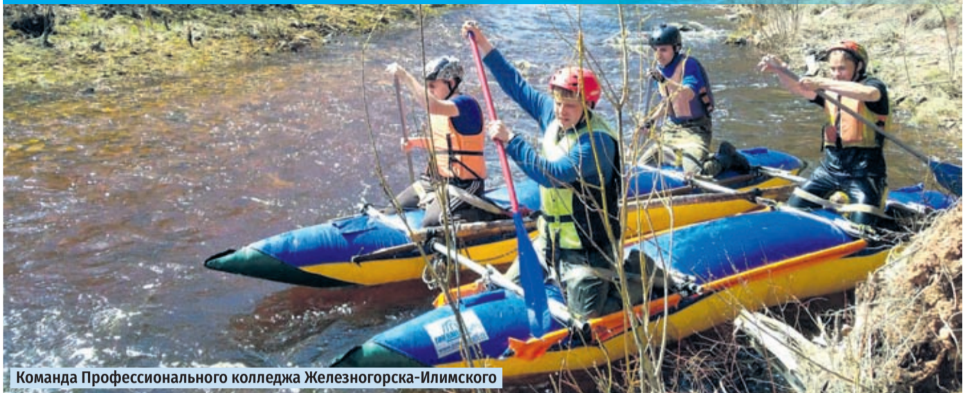
Команда Профессионального колледжа Железнодорожника-Илимского